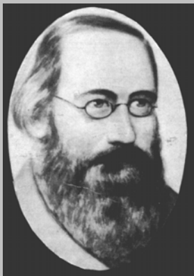
Jakob Lorber lo "scrivano di Dio" 1800-1864