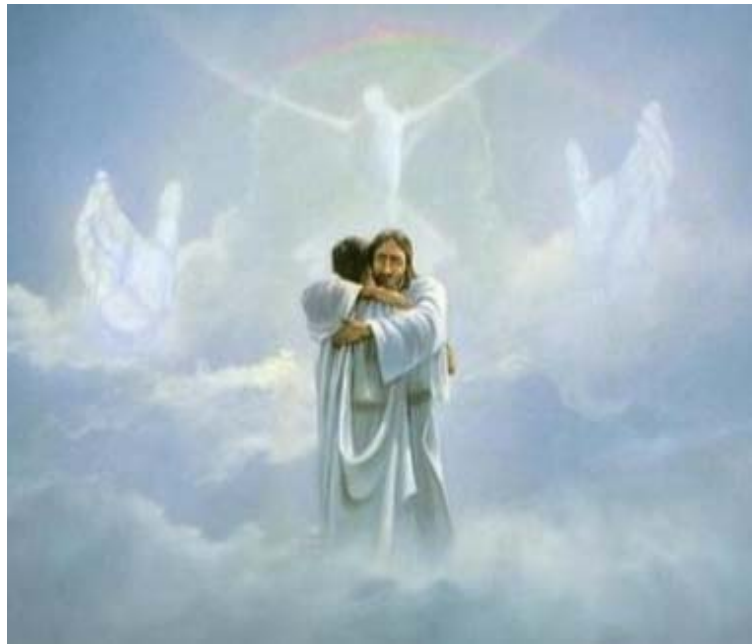
Love exchange between the Creator and the creature

act according to the Will of the Creator Himself.