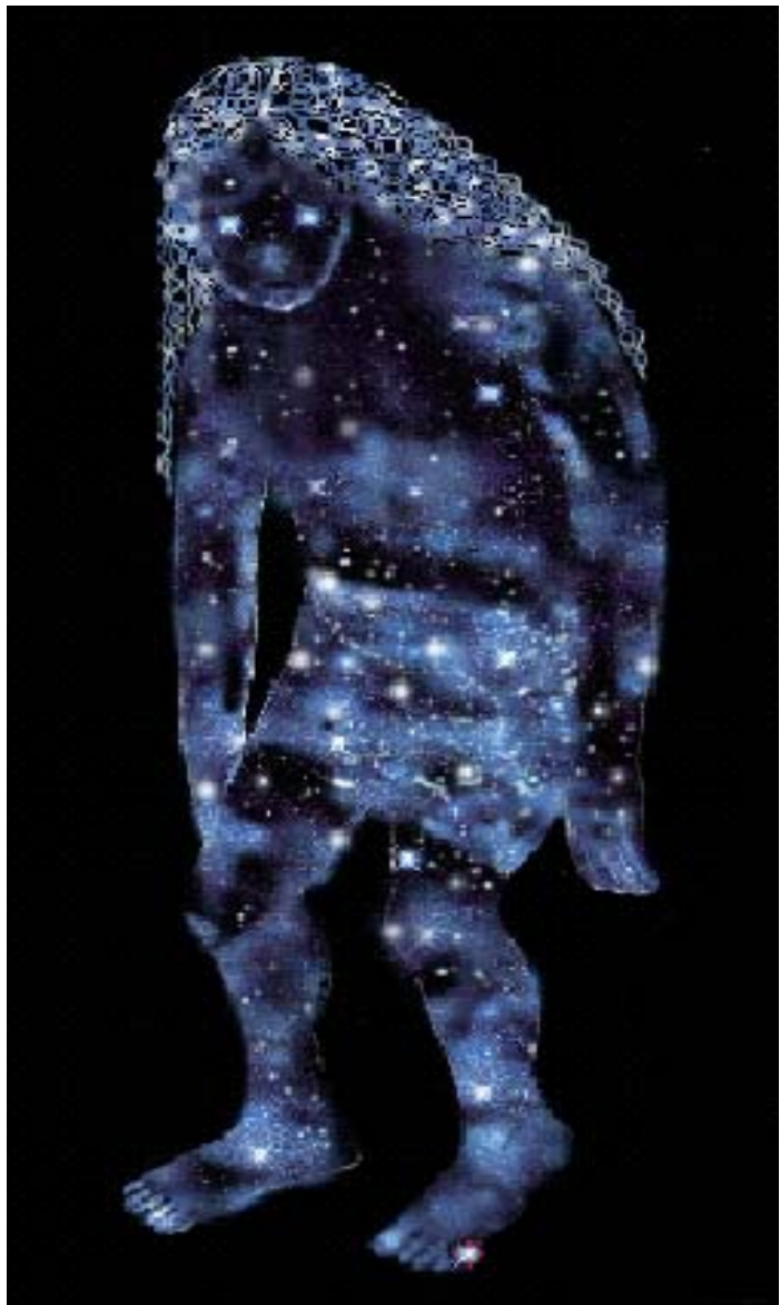
Satan, the materialized cosmic Man

2) Converting Satan through each single “particular” primordial spirit making up his being.