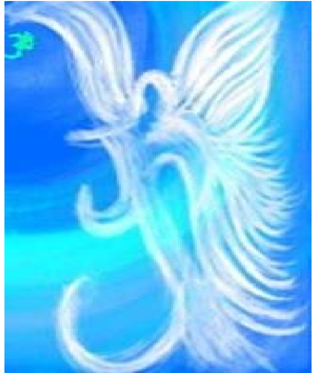
Lucifer, the first spirit created by God

C4/6) The only thing which marked Me out from him was “measure” and this consisted in the fact that all My constitutive elements were in the most complete and perfect order from everlasting, whereas his elements had to reach the due order, as if by themselves, through free fight, i.e. through the well-known spontaneity of action, or the Method of Self-formation. (SJG/2/229/6-7) (13)