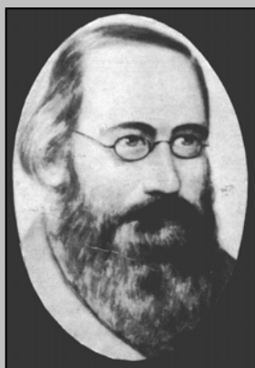
Jakob Lorber lo "scrivano di Dio" 1800-1864