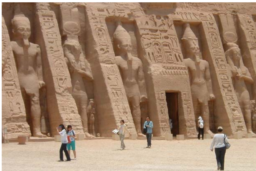
Il senso del “colossale” degli egiziani

C4/51) Infatti è proprio da quei tempi che gli egiziani cominciarono a costruire le loro opere colossali, come ad esempio i sette giganti che sostengono il tetto del tempio di JABUSIMBEL. (GVG/4/203/3-9) (56)