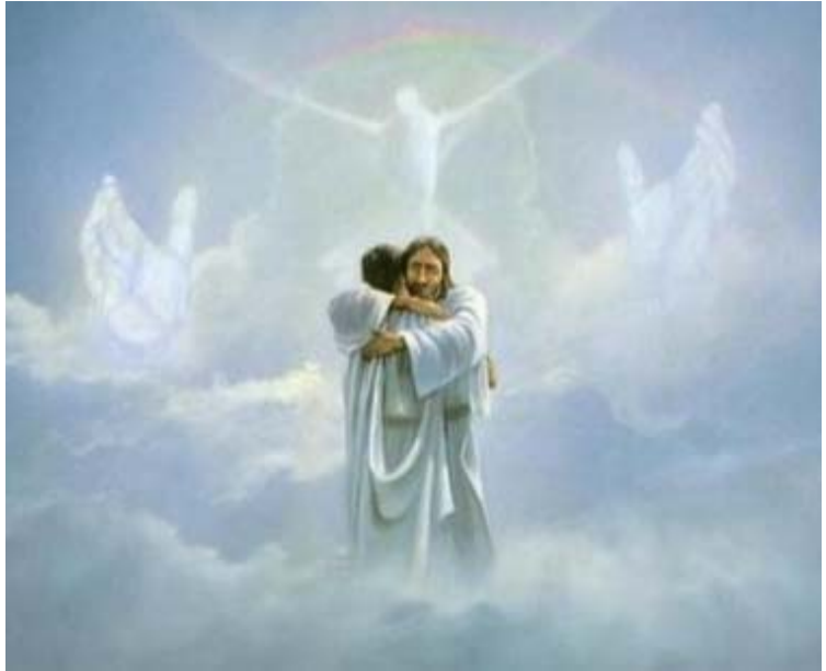
Scambio d’amore tra il Creatore e la creatura

C4/23) Ma per raggiungere questa Mia suprema Meta e questa Mia vitale beatitudine, Io sono costretto ad attuare il noto Metodo dell’Autoformazione che vi ho precedentemente e ripetutamente spiegato, ma se Io ve l’ho ripetuto molte volte è soltanto perché volevo farvelo comprendere molto bene e dettagliatamente, poiché solo quando voi lo avrete ben compreso, soltanto allora comprenderete qual è l’unico sistema che Mi permette di “convertire” le Mie creature in “figli Mie”, e cioè in esseri liberi e indipendenti che di loro spontanea volontà hanno scelto di stare per sempre in compagnia del loro Creatore e amarLo quale il loro unico Padre.