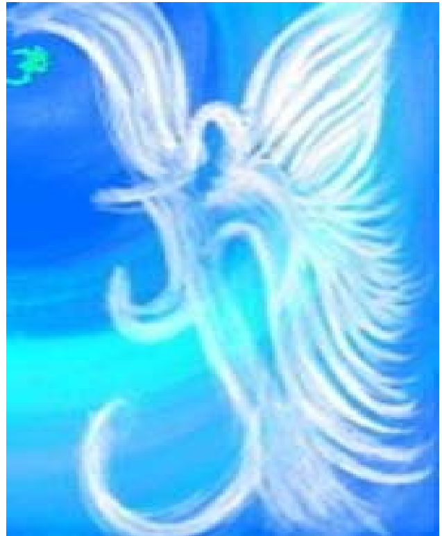
Lucifero, il primo spirito creato da Dio

C4/6) L’unica cosa che Mi differenziava da lui era la “misura”, e questa consisteva nel fatto che tutti i Miei Elementi costitutivi erano nell’ordine più completo e perfetto dall’Eternità, mentre i suoi dovevano raggiungere l’ordine dovuto, come per virtù propria, tramite la libera lotta, cioè tramite la nota spontaneità d’azione, ovvero il Metodo dell’Autoformazione. (GVG/2/229/6-7) (13)