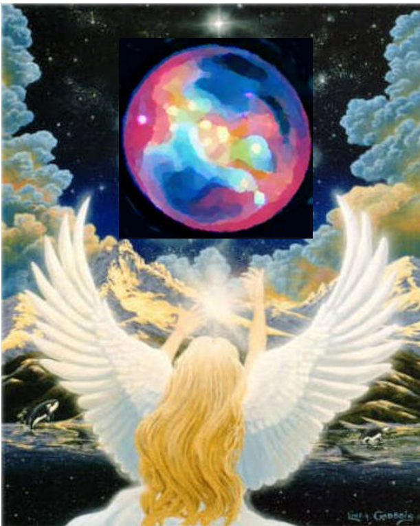
Il "primo" pianeta per la conversione di Satan

C4/40) Quando dunque Satana divenne Satan, e cioè gli fu tolta la possibilità di agire istantaneamente quale spirito libero attraverso il suo imprigionamento nella materia (TE/56/5) (47) , la quale non è altro che lo "spirituale imprigionato" (GVG/4/103/4) (48) , e precisamente due terzi è essenza animica e un terzo è sostanza inanimata che costituisce l'involucro (GVG/2/232/3) (49) , allora la sua intera anima venne materializzata in corpi mondiali (SS2/57/ 10-11) (50) , e si rese visibile nella forma di un Uomo cosmico, mentre lui, quale spirito, scelse un grande pianeta del vostro sistema solare che orbitava tra Marte e Giove, e promise che si sarebbe umiliato e perciò sarebbe ritornato da Me. (VM/46/7) (51)