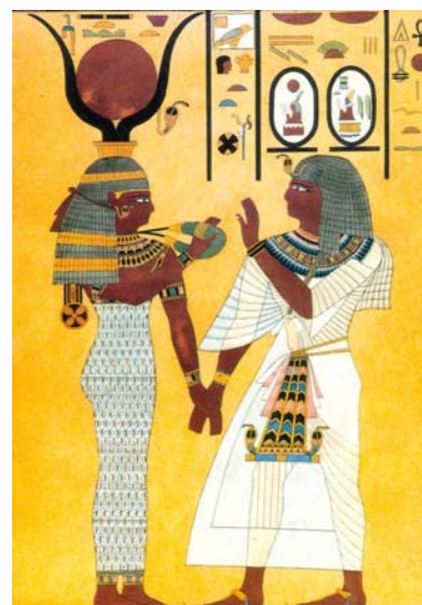
La foggia del vestiario egizio