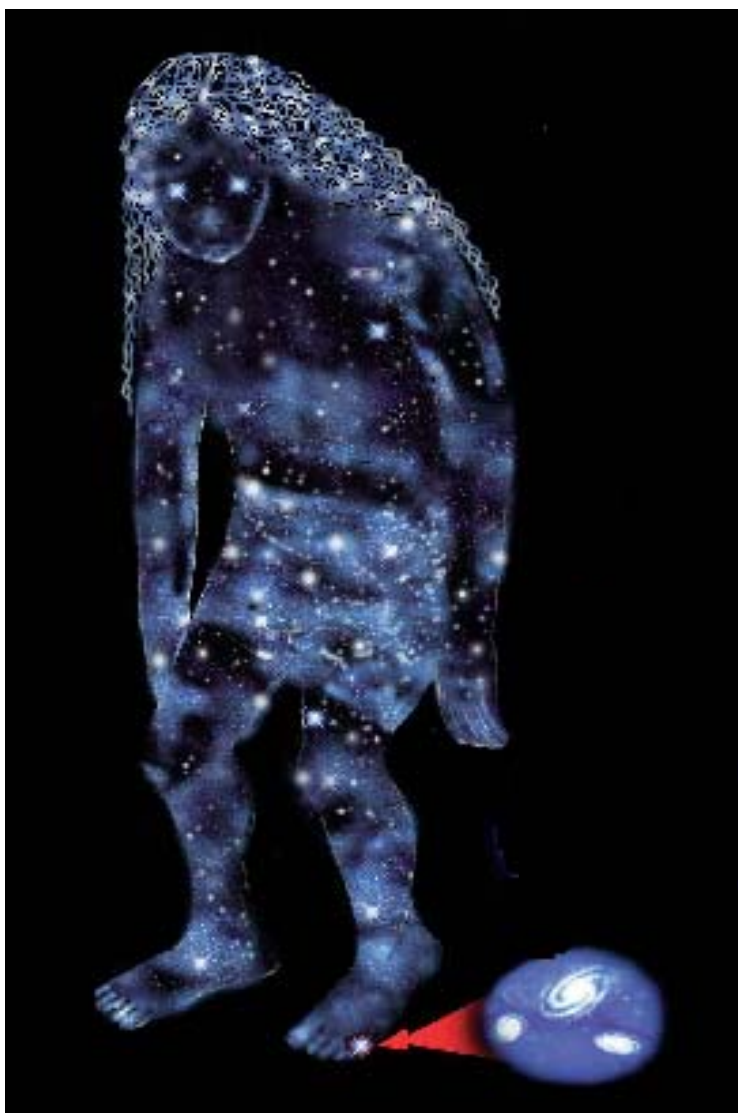
Satan, l’Uomo cosmico materializzato