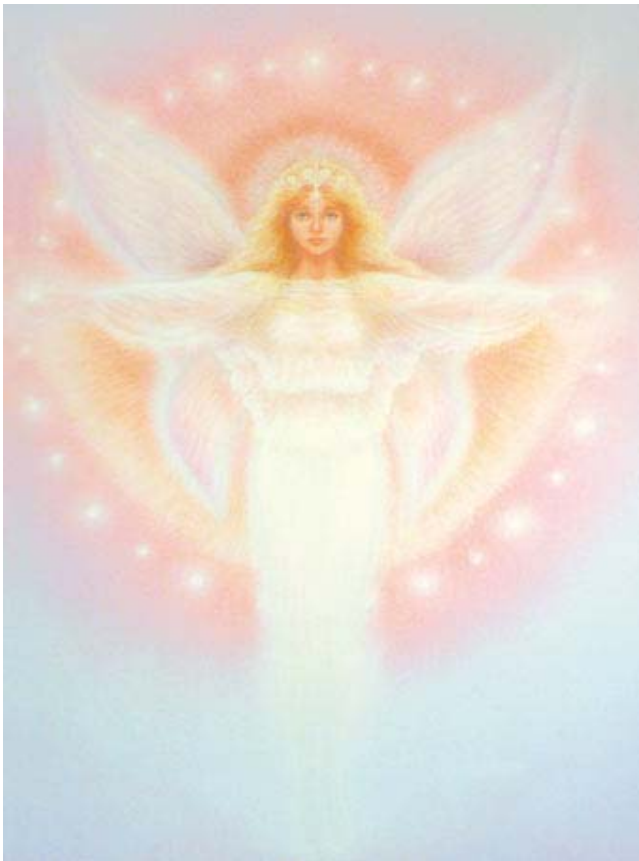
“Satana” equivaleva al polo contrario di Dio

C4/7) A questo punto Io presi questo concetto concreto di nome Lucifero e attraverso la Mia Volontà lo “consolidai”, e cioè gli diedi sostanzialità.