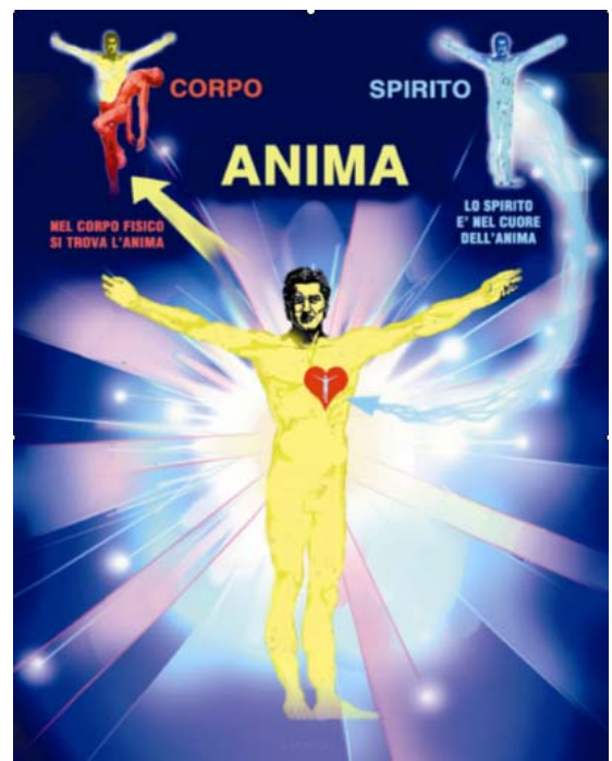
lo SPIRITO dimora nel cuore dell'anima l' ANIMA è compenetrata nel CORPO

27. O Padre santo, accogli benevolmente questo mio racconto certamente quanto mai imperfetto, e completa Tu, secondo la Tua santa Volontà, quanto vi è di imperfetto in esso; e che il Tuo santo Volere sia sempre fatto! Amen».