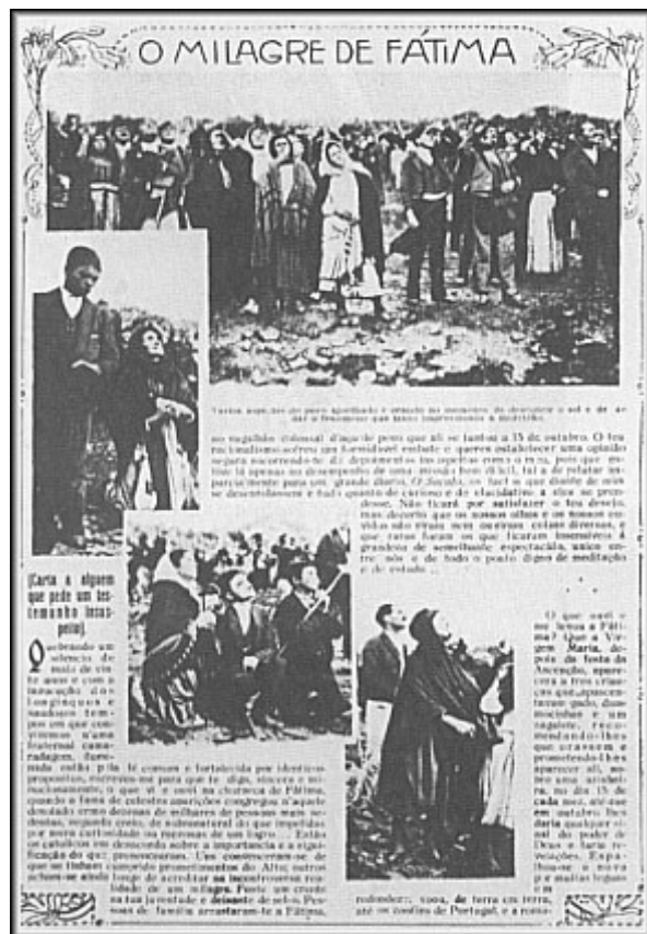
Una pagina della rivista Ilustração Portuguesa che ritrae la folla che osserva il "miracolo del sole". (29-10-1917)

Ma ecco che un grido colossale si alza, e dagli spettatori che si trovano più vicini si ode gridare: