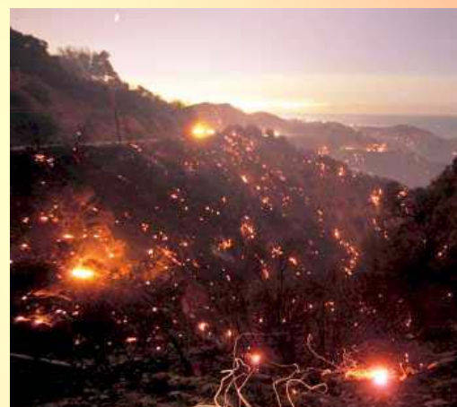
Una veduta delle colline di Malibu

La costa californiana devastata dalle fiamme ospita le ville di star come Mel Gibson, Sting, Barbra Streisand, Richard Gere, Jennifer Aniston, Pierce Brosnan, Dick Van Dyke, Olivia