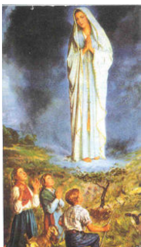
Apparizione a Fatima