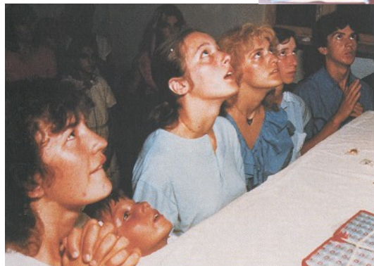
I sei veggenti di Medjugorje in estasi

In una serie di apparizioni, che ancora oggi continuano , con diversa frequenza, a tutti e sei i veggenti, la Madre di Dio invia al mondo continui messaggi, brevi e profondi, comunque sempre in perfetta sintonia con il Catechismo della Chiesa Cattolica