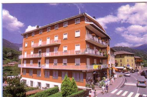
Sede e ufficio della Casa editrice GESÙ La Nuova Rivelazione