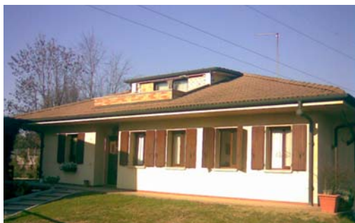
Sede e ufficio dell'Associazione Jakob Lorber