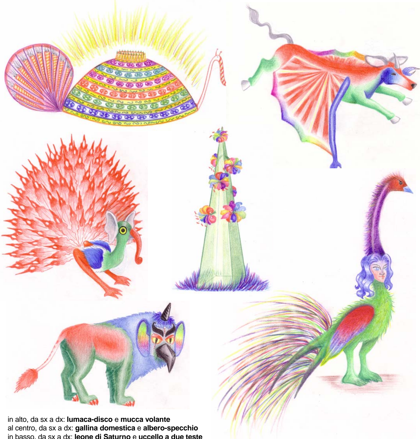
in alto, da sx a dx: lumaca-disco e mucca volante al centro, da sx a dx: gallina domestica e albero-specchio in basso, da sx a dx: leone di Saturno e uccello a due teste