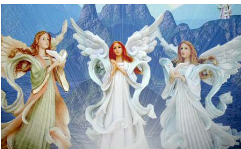
perfect angelic beings

C3/3) In order to do this, I had to work out a "special" Method that at the outset I applied to the first primordial spirits (SJG/4/103/1-2) (10) and later on to all the human beings of this Earth of yours.