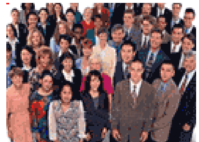
Free human beings

C3/6) But only when I'll have explained My entire Project, will you be able to understand what you rightfully, from your human point of view define as (SJG/8/152/5-13) (20) , "dreadful, horrible and inhuman".