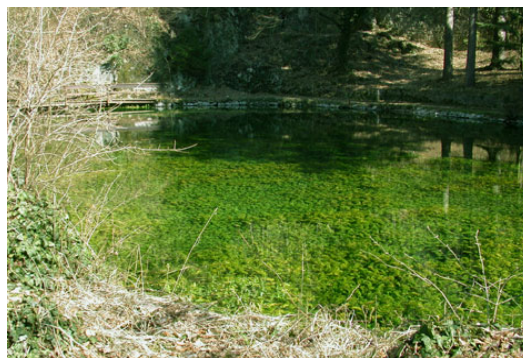
il laghetto dell'Andritz

7. Guardate, come voi mi vedete qui dinanzi ai vostri occhi, io penetro solo attraverso piccole arterie di cento klafter (190 m) su fino a questo punto visibile. E vedete, se non fosse assegnato anche al mio condotto uno spirito benevolo e non pulisse le mie vie, queste si sarebbero già da molto tempo ostruite a causa della mia ottusa inettitudine oppure si sarebbero rovinate in un altro modo. Ma proprio questo spirito a me assegnato, e che sorveglia le mie vie, conserva queste mie piccole vie quasi da mille anni nel medesimo, tranquillo, soave e bell'ordine e non mi lascia diventare torbida per essere essere di eloquente esempio, affinché gli uomini, che