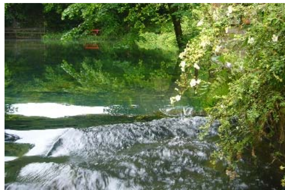
il laghetto e la sorgente Andritz

13. Vedete, il primo movimento sarebbe per voi, se foste nella vita dello spirito, non soltanto un movimento causato da grossolane circostanze materiali, ma scoprireste con grande chiarezza una scrittura del tutto meravigliosa, ben leggibile, scritta dall'onnipotente Dito di Dio. Sennonché, dato che non ne siete capaci, voglio farvi conoscere, per concludere brevemente, qualcosa di questo A B C spirituale e del suo profondo significato.