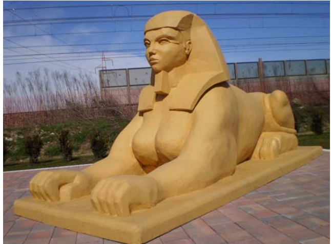
La Sfinge "femmina" presso la Mostra

2. Dice Marco: «Io vedo nuovamente la colossale immagine dello Shivinzi ed alcune piramidi; davanti alla più grande ci sono due di quelle colonne a facce piane che terminano a punta e che vengono chiamate OUBELISKE, ed a fianco della grande piramide, nella realtà alla distanza di forse duecento passi, ciò che in base al disegno è difficile da stabilire, vedo ancora una statua colossale.