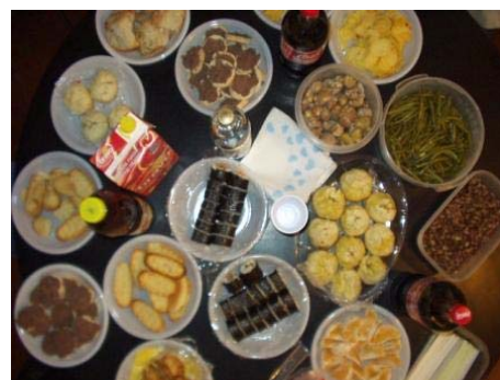
i cibi complicati di oggi

Con un tale regime essi sciupano ed abbruttiscono talmente la loro natura che la loro anima in essa si irretisce ed impastoia come l'uccello fra le bacchette invischiate, cosicché le è impossibile acquistarsi quella leggerezza e quella scioltezza necessarie per avere libertà di movimenti anche all'infuori della materia.