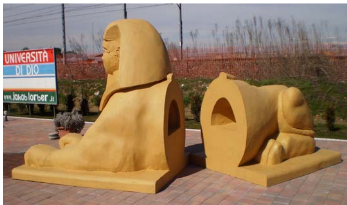
Cavità all'interno della Sfinge

7. Ecco: su questa perla vedete disegnata la statua raffigurante un essere mezzo umano e mezzo animale [Sfinge]; essa era cava, e all'interno un uomo poteva salire nella testa su per una scala a chiocciola, e dalla bocca della statua, che era incavata all'ingiù a