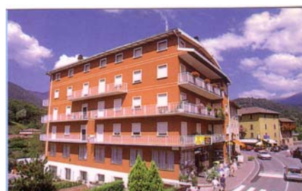
Sede della casa editrice

Carissimi Amici e Amiche, all'invito pubblicato nel precedente Giornalino hanno aderito circa una ventina di persone. Ora che il 3° volume "Doni del Cielo" è già stato stampato, vi rinnovo l'invito di venire alla Festa di Domenica 25 Ottobre presso la Casa Editrice GESÙ La Nuova Rivelazione per ringraziare e festeggiare il Signore per avere raggiunto tutti insieme l'obiettivo della stampa dell'intera Opera di Lorber.