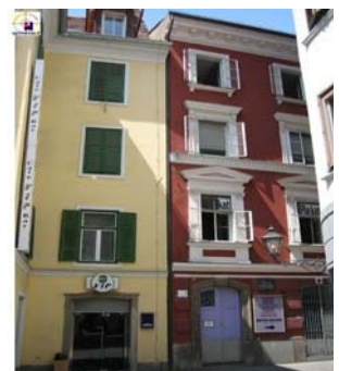
La casa di Lorber a Graz (quella rossa)