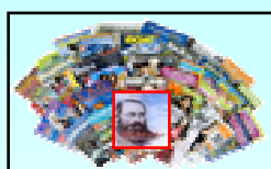
Riviste e Giornali