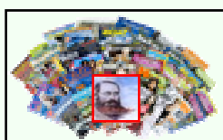
Riviste e Giornali