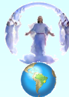
Gesù sta già ritornando sulla Terra

«Verrà fra gli uomini una tribolazione come mai ce ne fu una sulla Terra! Ma da ora fino a quel tempo trascorreranno mille e non più di mille anni ancora! Da quel tempo in poi la Terra ridiventerà un Paradiso, ed Io guiderò per sempre i Miei figli sul giusto sentiero». (Il Grande Vangelo di Giovanni, vol.1, cap.72)