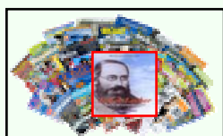
Riviste e Giornali