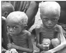
morti per fame