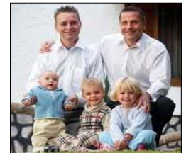
adozioni ai gay

SATANA si sta scatenando sempre più potentemente, come è preannunciato nell'opera di Lorber tramite la cosiddetta " Fase di purificazione dell'Umanità ", che dovrebbe concludersi entro il 2031 secondo l'autore del libro-estratto dal titolo " FINE DEL MONDO ENTRO IL 2031 – Come salvarsi dall'Apocalisse ", anche se altri amici di Lorber hanno ipotizzato il 2025 mentre altri non ci credono affatto.