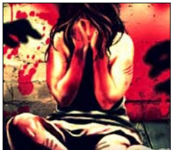
stupri e violenze