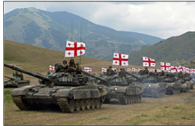
388 guerre e conflitti nel mondo nel 2014