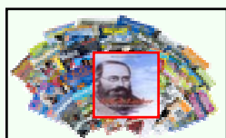
Riviste e Giornali