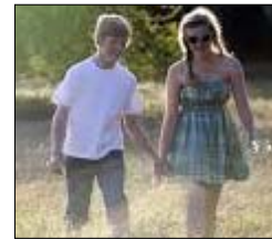
sexo a 14 anni