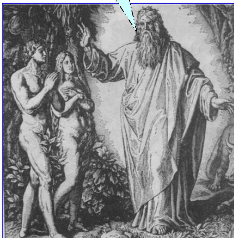
DIO istruisce Adamo ed Eva

E' il Comandamento più difficile da osservare, poiché perfino la prima coppia umana, Adamo ed Eva, lo trasgredirono [SS/2/71/29]. Avvenne che Eva tentò Adamo, il quale NON riuscì a vincere la sua brama sessuale e si unì a lei, commettendo il "peccato originale". [GFD/2/8/9-11]. Poi vennero perdonati e lasciati ancora a vivere nel paradiso terrestre [GFD/1/11/24]. Infine vennero cacciati a causa di un'orgia sessuale collettiva. [GFD/1/13/13 e 41].