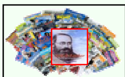
Riviste e Giornali