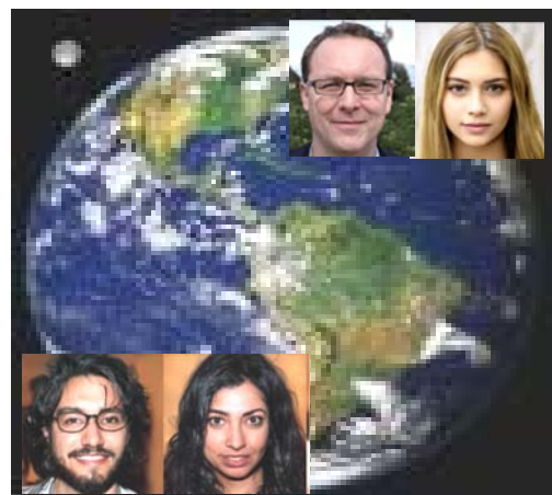
esseri umani della Terra

(dal libro IL GRANDE VANGELO DI GIOVANNI , vol. 3, cap. 221)