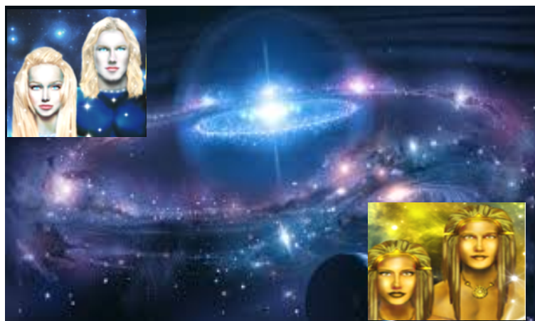
esseri umani di altri mondi