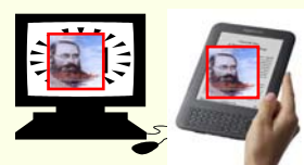
Internet – eBook

29 "Operai nella Vigna del Signore" per DIVULGARE l'Opera di Lorber in Italia