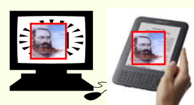
Internet – eBook

29 "Operai nella Vigna del Signore" per DIVULGARE l'Opera di Lorber in Italia