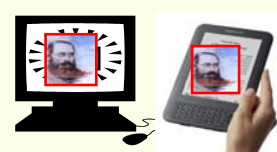
Internet – eBook

28 "Operai nella Vigna del Signore" per DIVULGARE l'Opera di Lorber in Italia