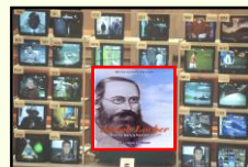
Radio - TV