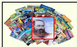
Riviste e Giornali