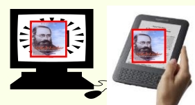
Internet - eBook