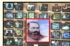
Radio - TV