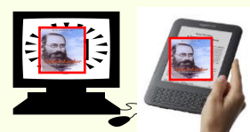
Internet - eBook