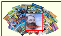
Riviste e Giornali