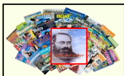
Riviste e Giornali