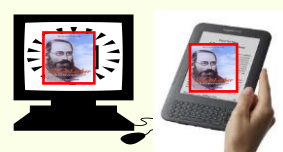
Internet - eBook