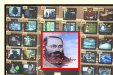
Radio - TV