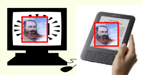
Internet - eBook