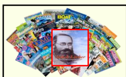
Riviste e Giornali